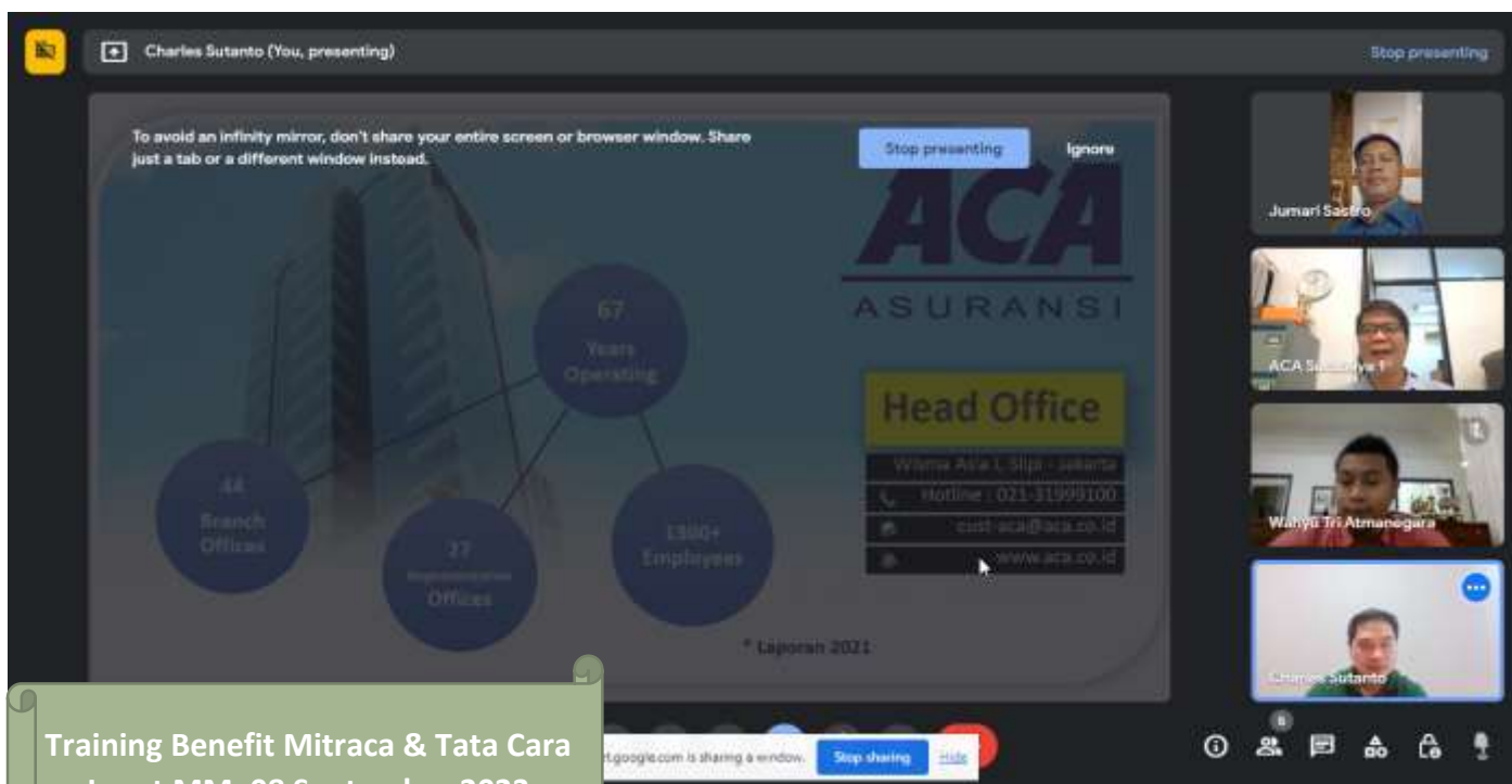
Training Benefit Mitraca & Tata Cara Input MM, 08 September 2023